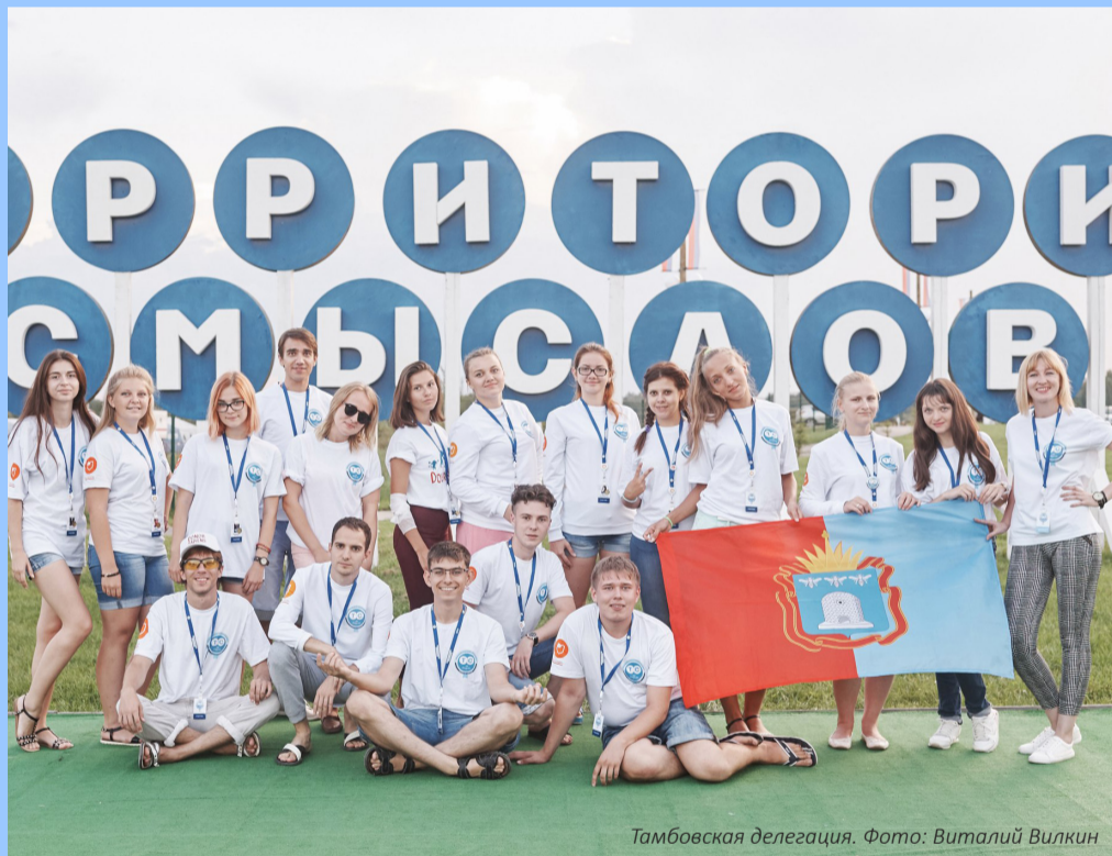
Тамбовская делегация.

мый счастливое воспоминание в его памяти – объявление победителей, в числе которых его фамилия. А когда стало известно, что получил призовой грант на сумму 300 тысяч рублей... «Это первый форум, в котором я принял участие, и получение гранта стало для меня радостным, своеобразным шоком. Организация форума на высочайшем уровне! Образовательная программа подобрана по интересам, так что узнал для себя много нового и полезного. Хочу в следующем году вновь туда поехать. Там особая атмосфера, очень интересные люди, море, солнце и улыбки».