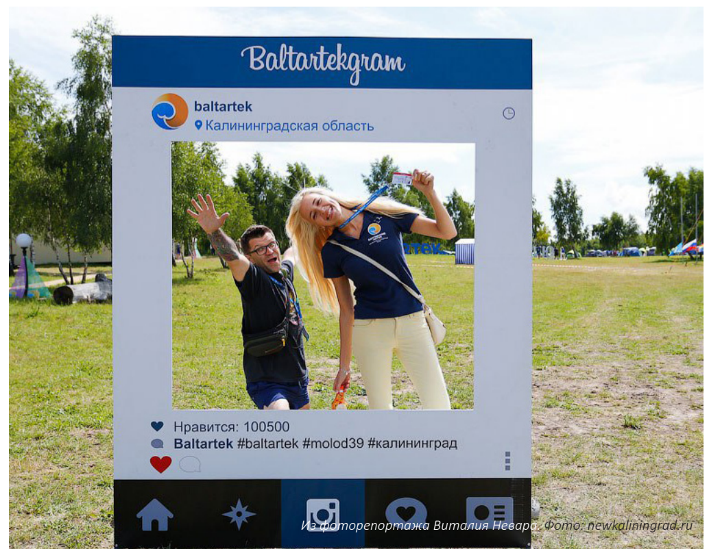
Из отчета журналиста Виталия Неварова.