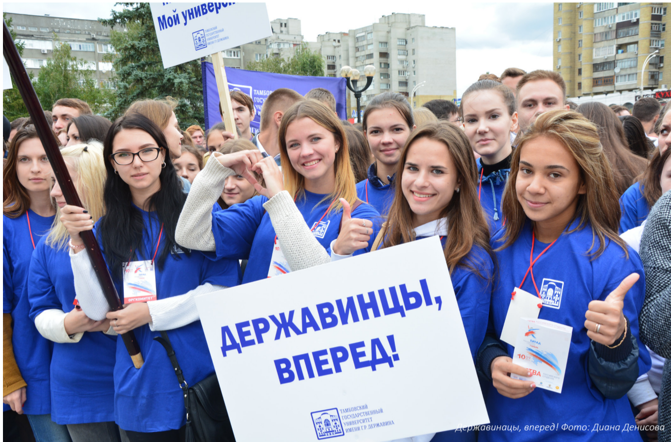
Державинцы, вперед!

10 сентября в нашей стране состоялось одно из самых масштабных и по-настоящему грандиозных молодежных событий – Парад Российского Студенчества. Посвящение в студенты прошло в 30 городах-участниках, исключением не стало и самое сердце России – наш родной и любимый Тамбов. На площади у ледового дворца спорта «Кристалл» оказалось более трёх тысяч учащихся вузов и учебных заведений среднего профессионального образования Тамбовской области, которые пришли на парад с целью объединения всего студенческого общества.