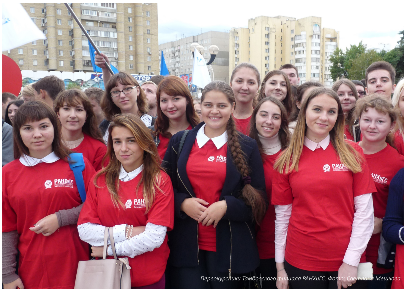
Первокурсники Тамбовского филиала РАНХиГС.