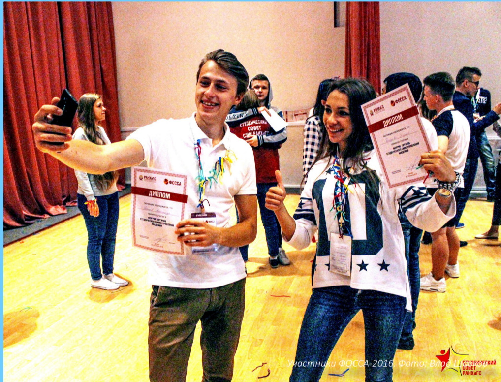
Участники ФОССА-2016.