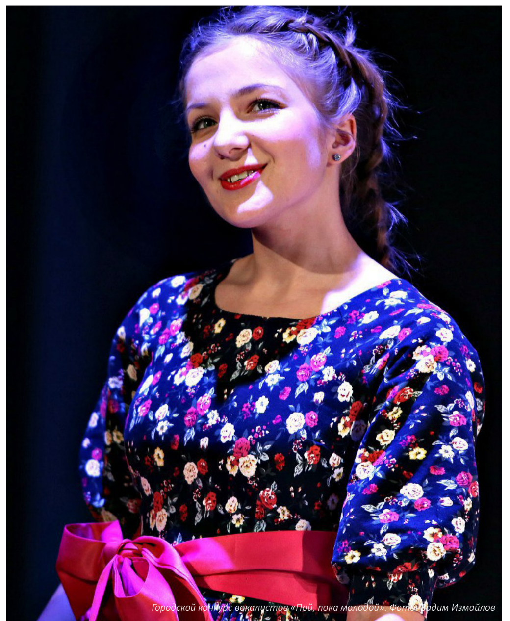
Городской конкурс вокалистов «Пой, пока молодой».