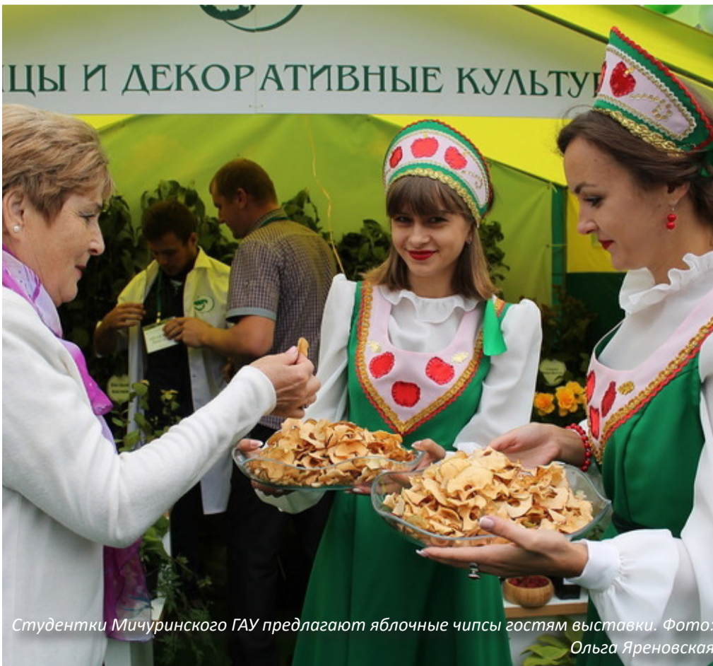
Студентки Мичуринского ГАУ предлагают яблочные чипсы гостям выставки.